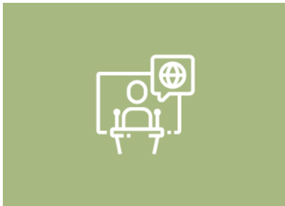
Aktuelles aus Wirtschaft & Politik