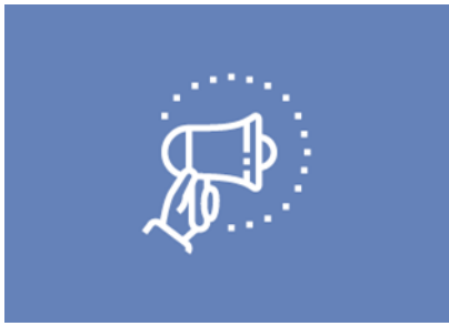
Neues vom FNG