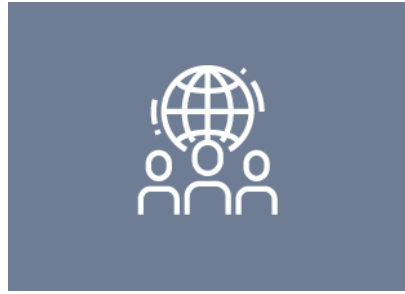
Neues von unseren Mitgliedern